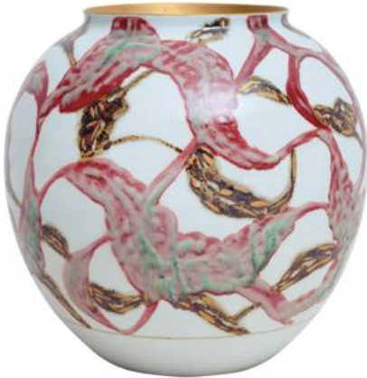
Rosy Twinkle of Gold, 2010, 33 cm, Musée Cernuschi