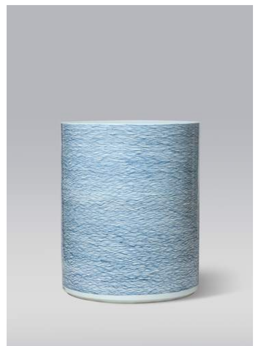
Lignes d'eau, 2015