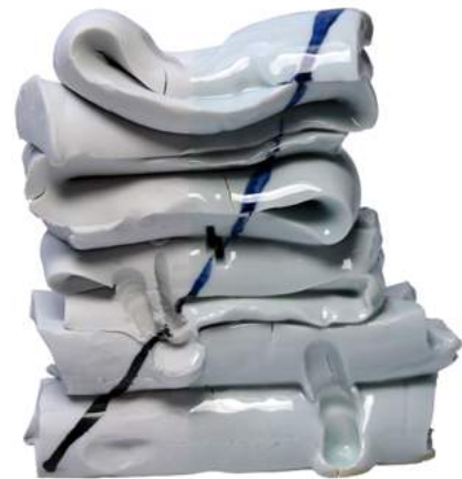
addit supra, 2016, Height 31 cm, MAAT, Lisbonne