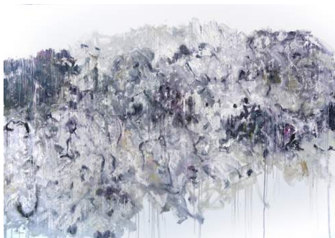
Between Porcelain and Stone II, 2008, Height 40