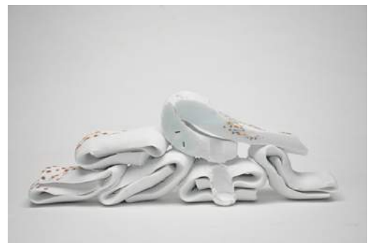
Addit supra, 2016