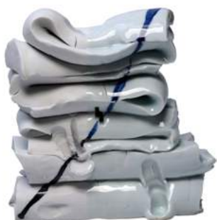
addit supra, 2016, Height 31 cm, MAAT, Lisbonne