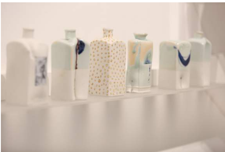
Appliance - form and process, 2004