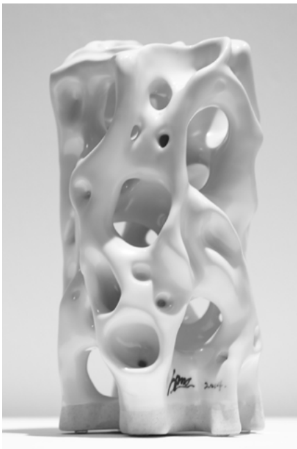
Brocade Zen Illusion, 2017, 200 cm x 280 cm, Minsheng Art Museum

Visuels disponibles en HD. Pour toute demande : eleonore@francoiselivinec.com