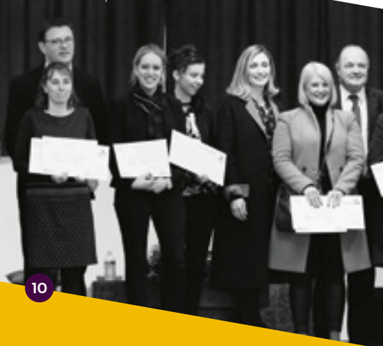
Remise de prix 2018

14 h · mairie déléguée de Cherbourg-Octeville · gratuit