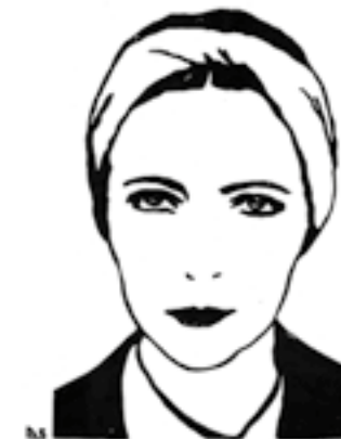
Portrait de Simone de Beauvoir

Grâce à elles présente des portraits de femmes gravées mettant en lumière leur engagement dans l'histoire. Réalisée par Sophie Degano, l'exposition